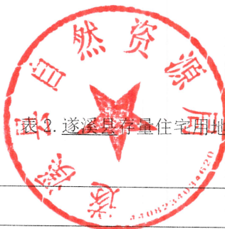
表2. 遂溪县存量住宅用地信息汇总表