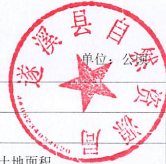
表 2. 遂溪县存量住宅用地信息汇总表